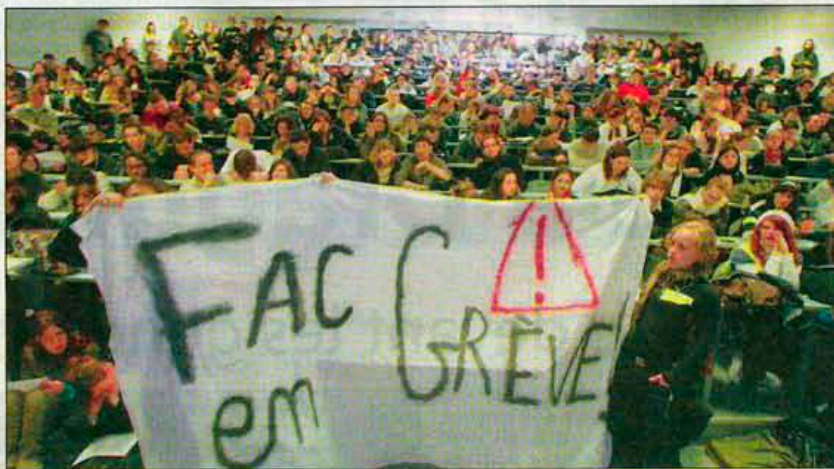
La grève oui, le blocage non : l'université du Sud Toulon-Var est le théâtre d'un mouvement de grogne généralisé derrière la réforme des enseignants-chercheurs, dont les rangs ne cessent de grossir

Après les réunions qui avaient animé la journée de lundi, les grévistes sont donc passés « à l'ac-